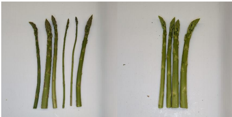
10 - Xenolim